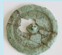
小形仿製鏡 (弥生時代)