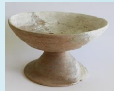
土師器 高杯 (古墳時代)