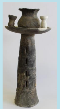
須恵器 子持器台 (古墳時代)