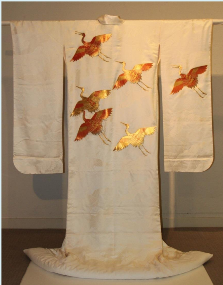
打掛「佐賀錦」(昭和期)