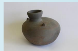
須恵器 平瓶 (古墳時代)